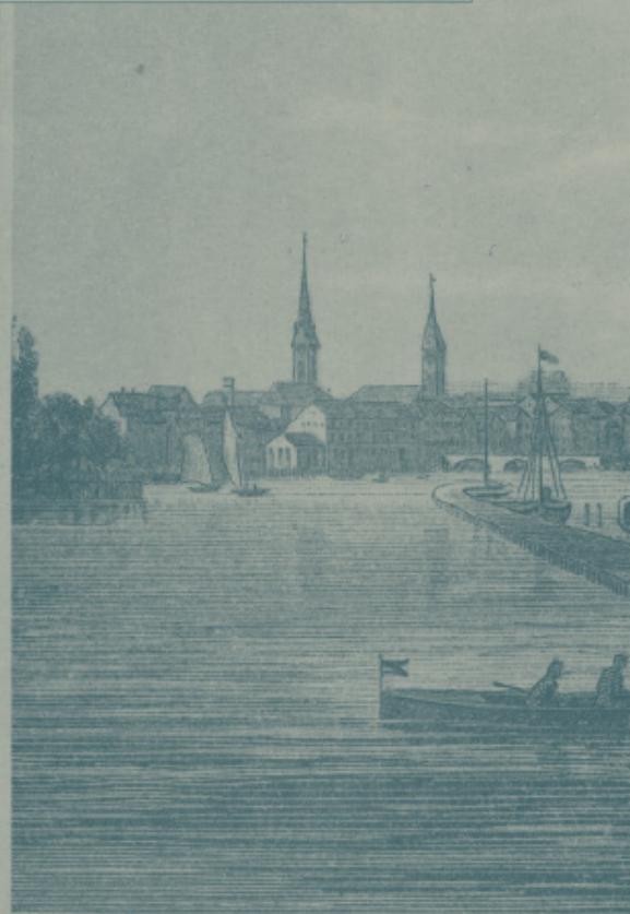
ATELIER K. BERTHOLD-STEINER PHOTOGR. ZÜRICH

Kornhaus und spätere Tonhalle beim Bellevue. ■ Baugeschichtliches Archiv Zürich: BAZ_101115