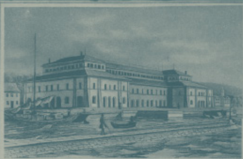
Kornhalle Zürich 1840 - 1867.

Kornhaus und spätere Tonhalle beim Bellevue.